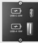
USB A&C Custom Modul